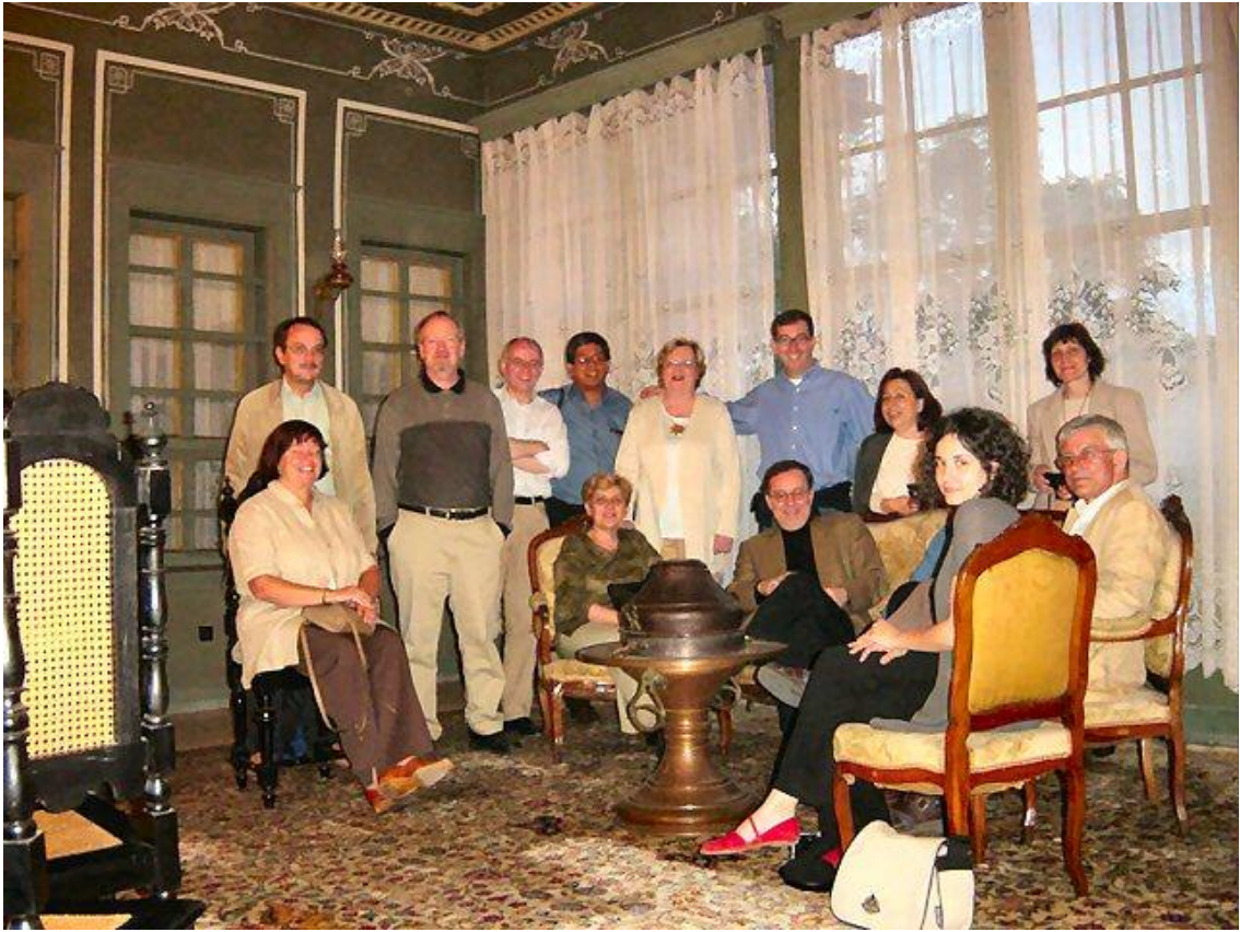
ICLAFI Plovdiv Bulgaria