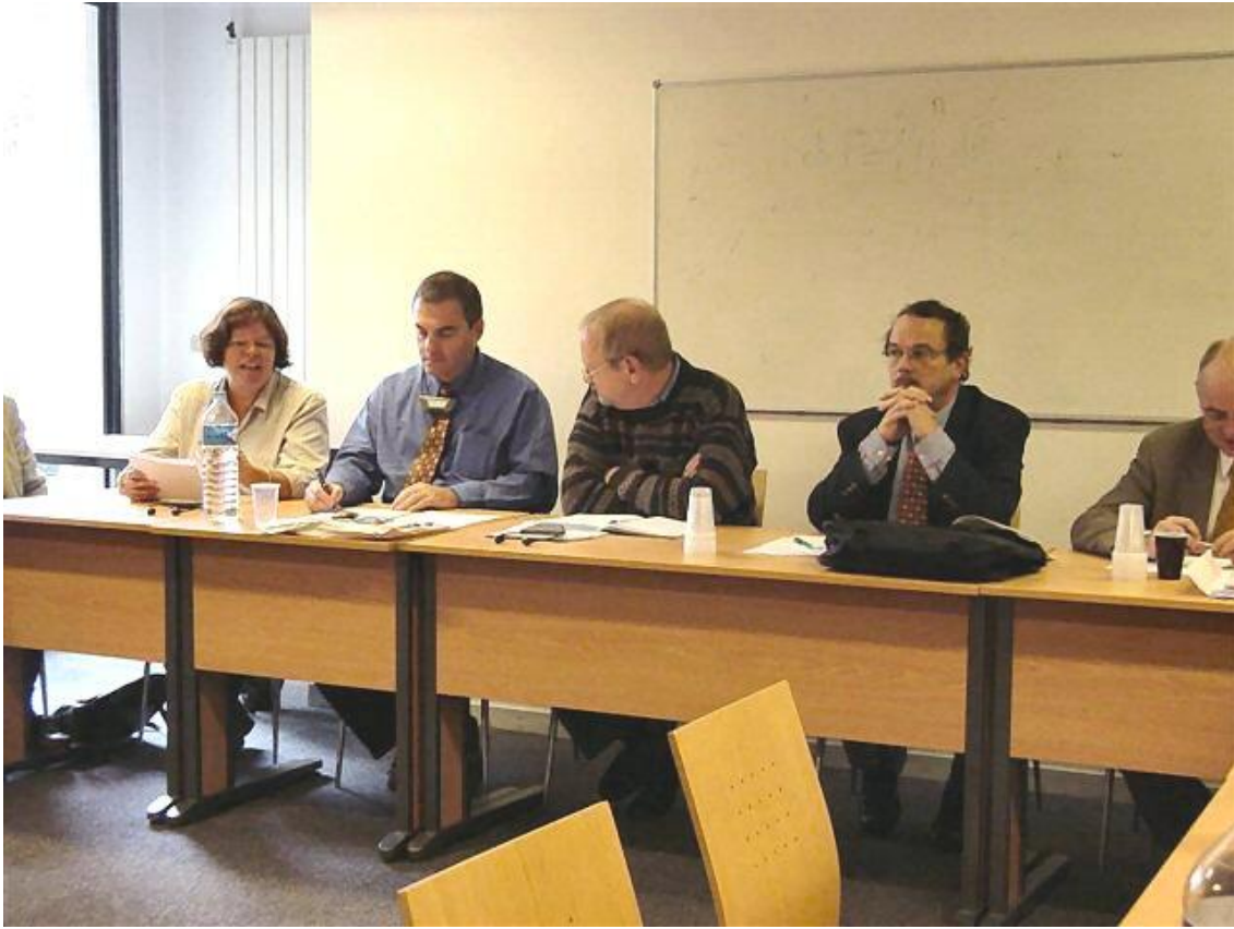
ICLAFI Paris Meeting