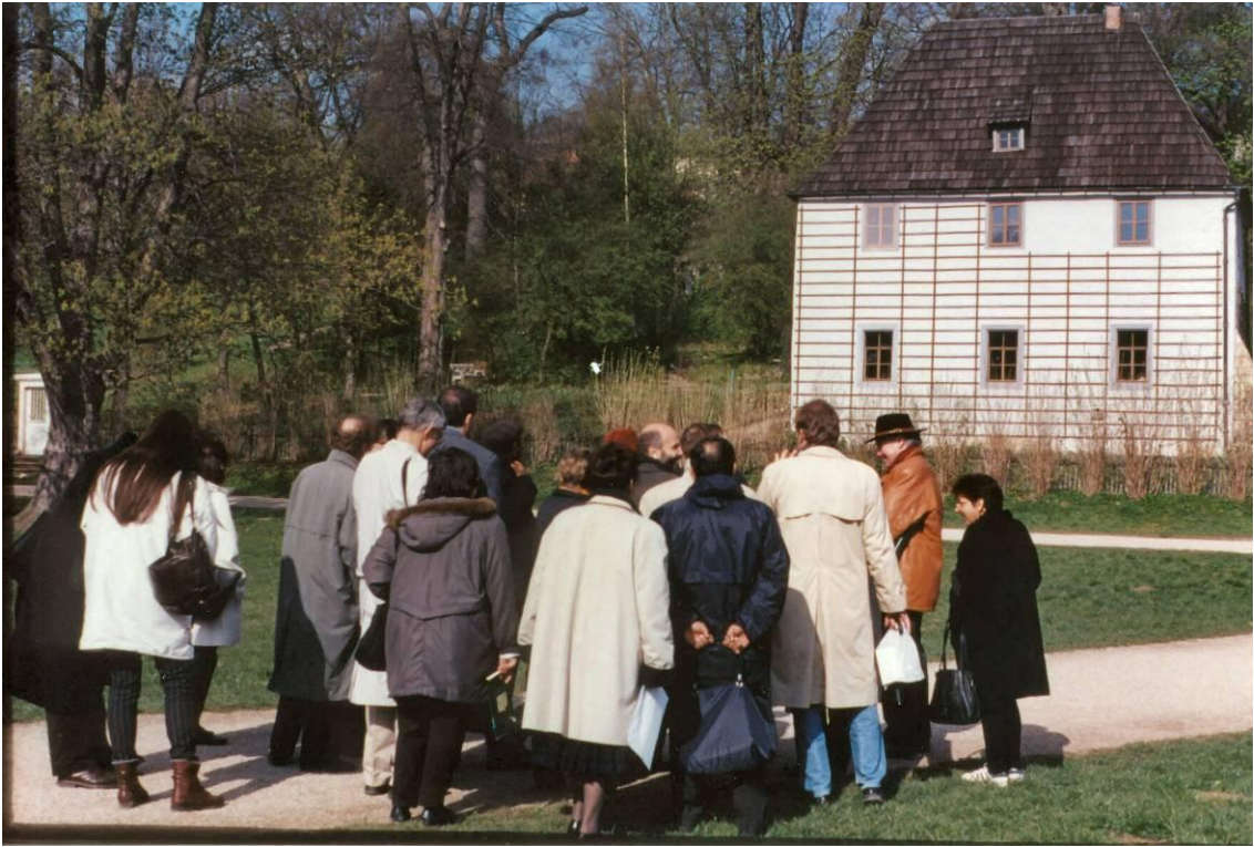
ICLAFI Weimar Meeting