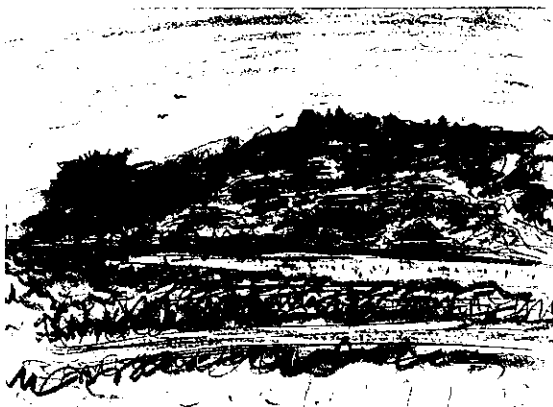
イラスト／前野まさる (以下全て)